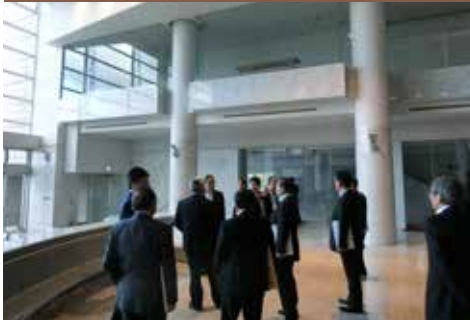
指定管理者が運営する施設（びわ湖ホール）を調査