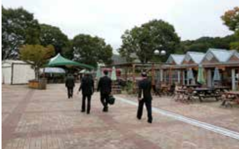
地方創生に関連した事業の取り組みを調査 (道の駅うつのみや ろまんちっく村)