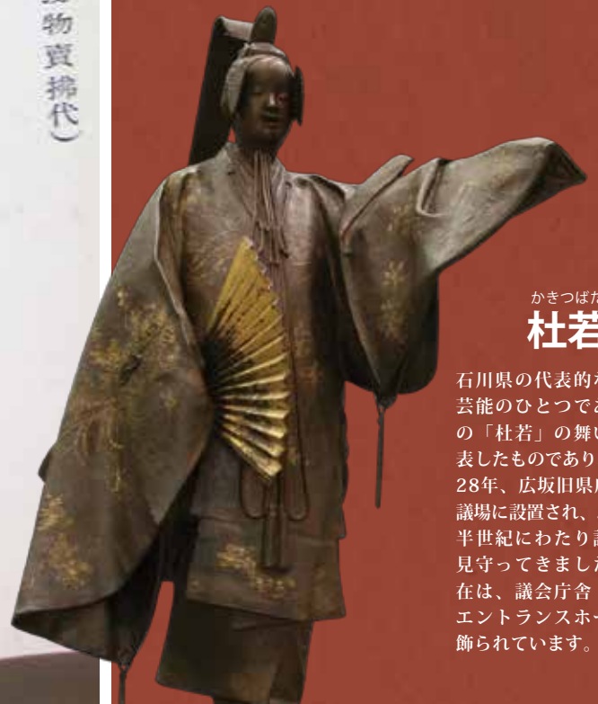
かきつばた 杜若像

石川県の代表的な伝統芸能のひとつである能の「杜若」の舞い姿を表したものであり、昭和28年、広坂旧県庁舎の議場に設置され、以来、半世紀にわたり論戦を見守ってきました。現在は、議会庁舎1Fのエントランスホールに飾られています。