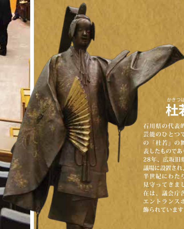
かきつばた 杜若像

石川県の代表的な伝統芸能のひとつである能の「杜若」の舞い姿を表したものであり、昭和28年、広坂旧県庁舎の議場に設置され、以来、半世紀にわたり論戦を見守ってきました。現在は、議会庁舎1Fのエントランスホールに飾られています。