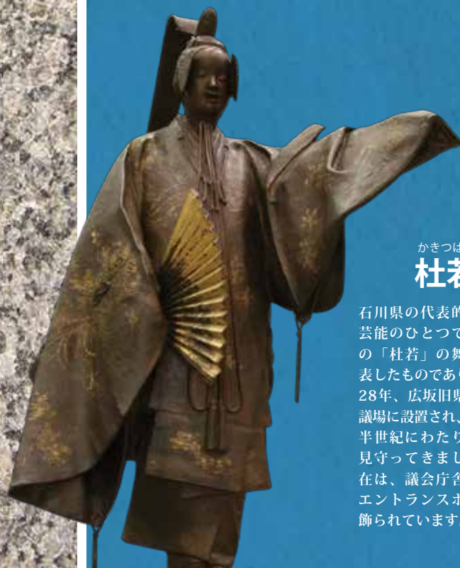
かきつばた 杜若像

石川県の代表的な伝統芸能のひとつである能の「杜若」の舞い姿を表したものであり、昭和28年、広坂旧県庁舎の議場に設置され、以来、半世紀にわたり論戦を見守ってきました。現在は、議会庁舎1Fのエントランスホールに飾られています。