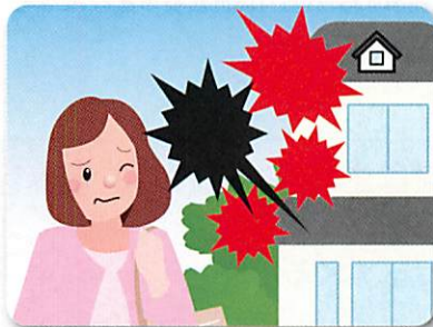
家の中から大声で怒鳴る声が聞こえる