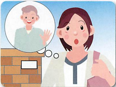
最近、外出している姿を見かけなくなった