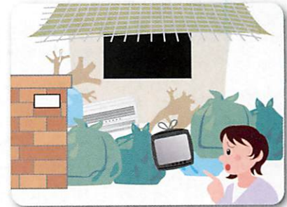
敷地内がゴミであふれるようになった