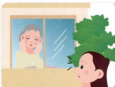
話をすると、深く悩んで(疲れて)いるように見える