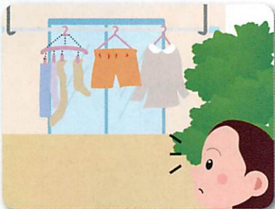
洗濯物が何日も取り込まれていない