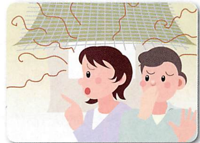
家の中から異臭がする