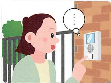
家を訪問しても顔を出してくれなくなった