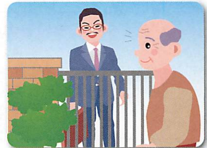
見なれない人が家に入りやすくなった