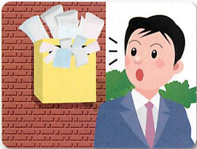
郵便受けに新聞や郵便物がたまっている