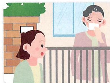
最近、具合が悪そうに見える